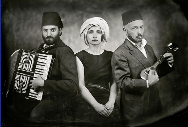
Erzählbus: © Mathis Leicht | Konzert: © The Disorientalists