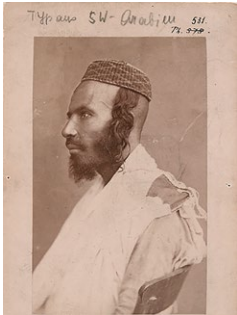
Abbildung: Siegfried Langer, Typen aus SW-Arabien; Jude, 10,2 × 7,7 cm, Albuminpapier, auf Untersatzkarton kaschiert, vor 1882, Provenienz: Ankauf von Franz Heger, Fotosammlung, Weltmuseum Wien, KHM-Museumsvorstand: Inv.Nr. 531.

Anschließend im Gespräch mit Dinah Ehrenfreund