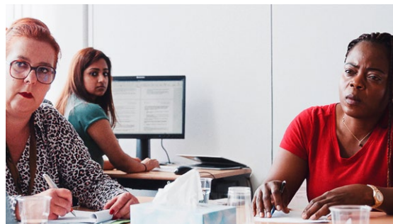
Filmstill „Die Anhörung“