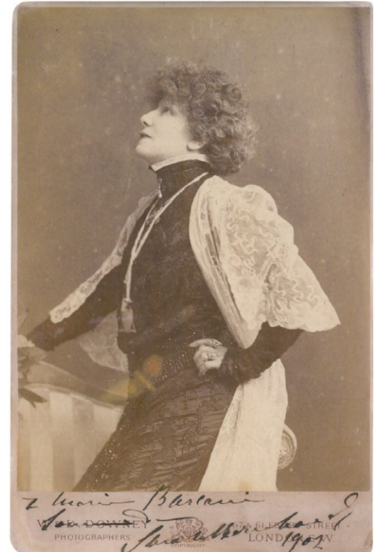
Porträt-Postkarte von Sarah Bernhardt London, 1901 Ehemaliges Jüdisches Museum in Prešov, heute Eigentum der Jüdischen Gemeinde in Prešov