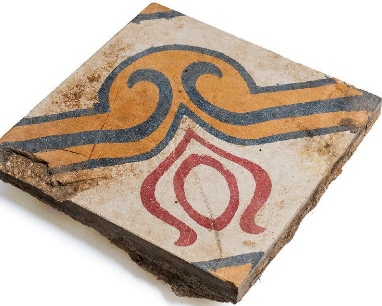
Bodenfliese aus einem verlassenen und abgerissenen Gebäude im ehemaligen arabischen Dorf As-Summail im Norden Tel Avivs Jüdisches Museum Hohenems, Foto: Dietmar Walsler

Di 8. November 2022 um 19.30 Uhr Jüdisches Museum Hohenems