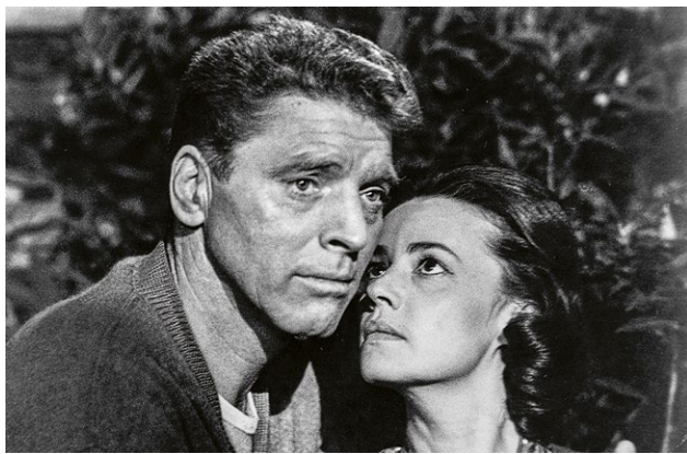
Filmstill aus „The Train“

Do 24. November 2022 um 19.30 Uhr Jüdisches Museum Hohenems