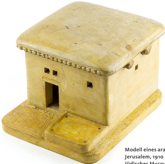
Modell eines arabischen Hauses Jerusalem, 1910 Jüdisches Museum Wien