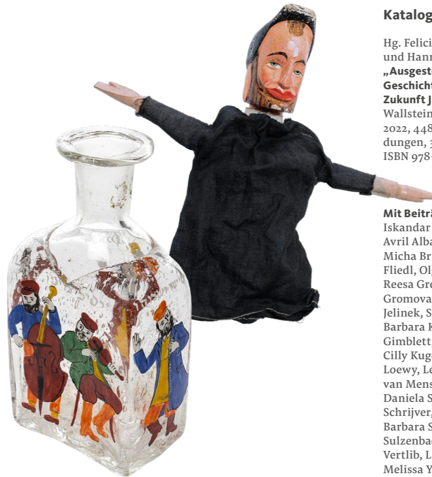
Handpuppe „Rabbiner“ | Flasche (Purim) mit Bemalung, JMH; Fotos: Dietmar Walser