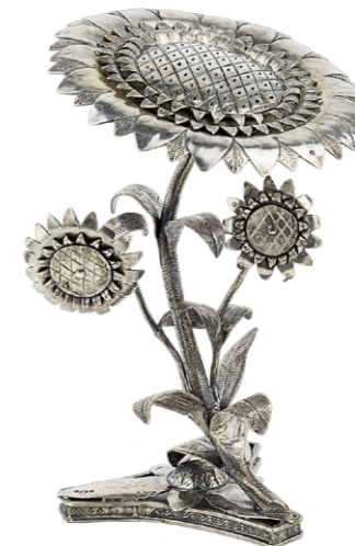
Besamim-Behältnis in Form einer Sonnenblume | Keren Kayemet Büchse Jüdisches Museum Wien; Fotos: Sebastian Gansrigler

Medienpartner ORF Ö1 Vorarlberger Nachrichten