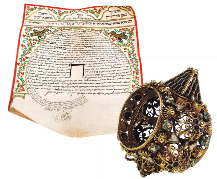
Ketubba (jüdischer Hochzeitsvertrag), Marokko, JMH; Foto: Dietmar Walser Hochzeitsring, Italien 16./17. Jhd, Jüdisches Museum London