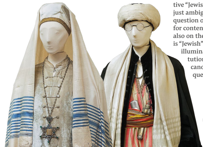
Figurine „Sefardische Jüdin aus Thessaloniki“ und Figurine „Rabbi aus Thessaloniki“, 19.-frühes 20. Jhd, Saloniki; Sammlung Jüdisches Museum Griechenland, Athen

Curated by Felicitas Heimann-Jelinek and Hannes Sulzenbacher