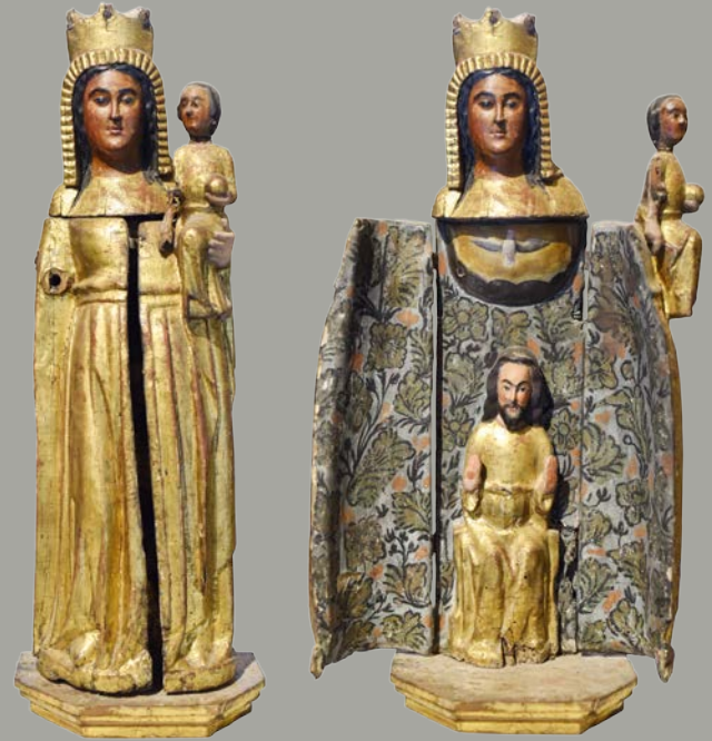
Vierge Ouvrante, Frankreich, Mitte 15. Jh., Palau del Vidre, Pyrénées-Orientales, Frankreich