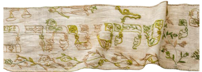
Tora-Wimpel, Fragment, 1693, Leinen, Seidengarn, Stiftung ehemalige Synagoge Ichenhausen